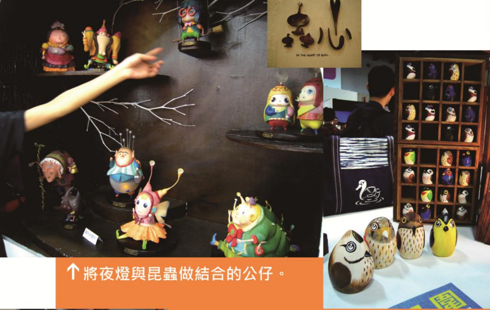
↑ 將夜燈與昆蟲做結合的公仔。

前面三張介紹我看完所有展場後，覺得做得最好的三組，這一張就大略的介紹其它我拍的模型。